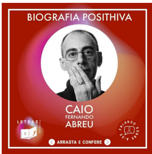
Figura 4 - Postagem do quadro Biografia Positiva.