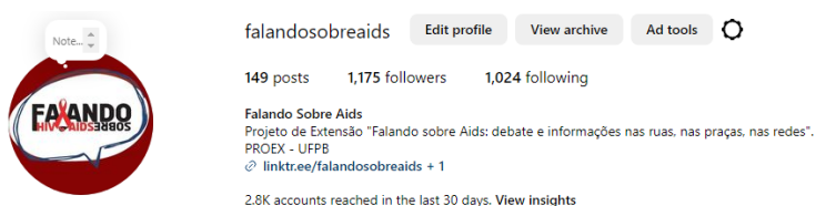
Figura 1 - Perfil do projeto no Instagram .

HIV e que, ao longo dos mais de 40 anos de história da epidemia, de alguma forma abordaram o tema em seus textos. Também aqui a temporalidade é um aspecto a se levar em consideração, e por isso assumimos a classificação comumente empregada na área que divide as obras em literatura pré-coquetel e literatura pós-coquetel, representadas por autores como Caio Fernando Abreu (pré-coquetel) e Marina Vergueiro (pós-coquetel). As publicações no Instagram incluíram uma introdução biográfica, uma contextualização literária e um momento artístico, no qual participantes do projeto realizaram leituras dramatizadas em formato audiovisual. Acreditamos que esta última se tornou uma forte ferramenta de aproximação entre nós, que compomos o projeto, as obras literárias escolhidas e as pessoas que seguem o nosso perfil (Moraes, Moraes e Souza, 2022).