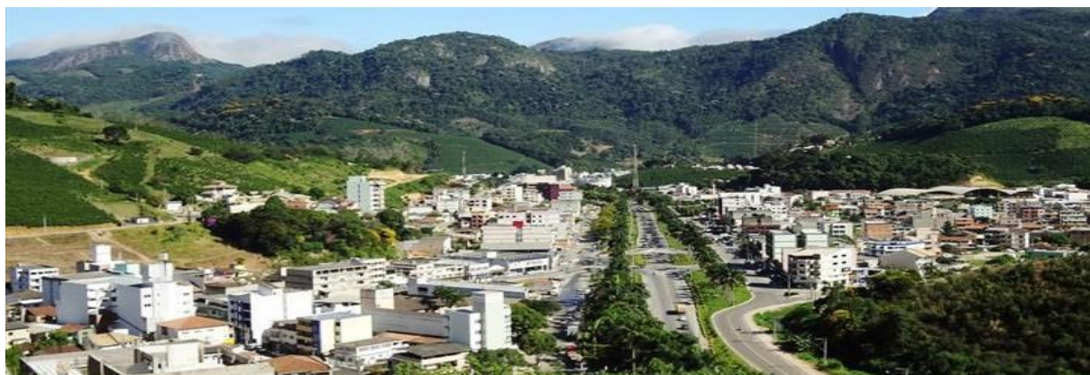
Figura 3: Panorama da sede do município de Venda Nova do Imigrante, cortada pela BR 262