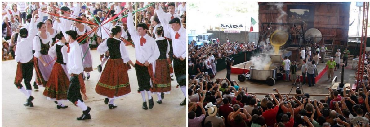
Figuras 4 e 5: Apresentação de dança típica durante a festa da polenta. O tombo da polenta