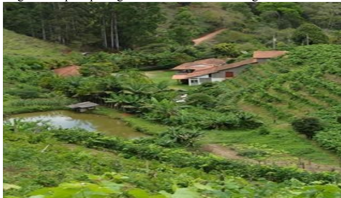
Figura 8: típica paisagem rural do circuito de agroturismo