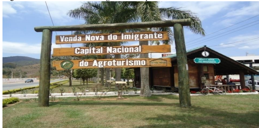
Figura 2: O título e o marketing do município

O município é cada vez mais conhecido pelos seus atrativos à prática do agroturismo, cuja sede ostenta com muito orgulho título de capital nacional do agroturismo. As novas atividades dessa modalidade de turismo já contam com mais de 20 (vinte) anos de consolidação no município, envolvendo inúmeras propriedades. Mas quais serão os fatores, os elementos, os predicados, os quais contribuem para que a atividade tenha se desenvolvido e ganho tanto destaque nesse município?