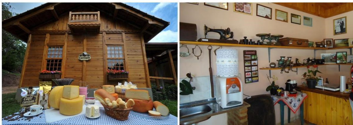
Figuras 6 e 7: loja com produtos da Família Carnielli; decoração interior com objetos antigos de família