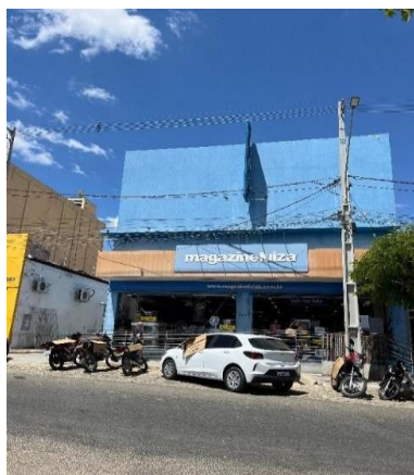
Fotografia 1 - Loja Magazine Luiza