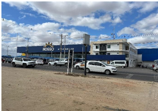
Fotografia 4 - Estrutura do Nosso Atacarejo