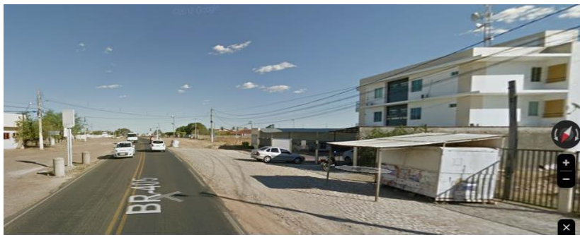
Fotografia 3 - Espaço antes da construção do equipamento comercial

Além dessas estruturas, a presença dos Atacarejos também tem chamado a atenção na configuração urbana de Pau dos Ferros. Esses equipamentos comerciais chegaram à cidade a partir de 2016 e tornaram-se um elemento importante para a ampliação de seu alcance espacial. Um exemplo é o estabelecimento da Rede Nosso Atacarejo, que conta com cinco lojas distribuídas em diferentes cidades: três no estado do Rio Grande do Norte (São Miguel, Açu e Pau dos Ferros) e duas no Ceará (Limoeiro do Norte e Lajes do Quixadá), conforme mostrado nas fotografias 3 e 4.