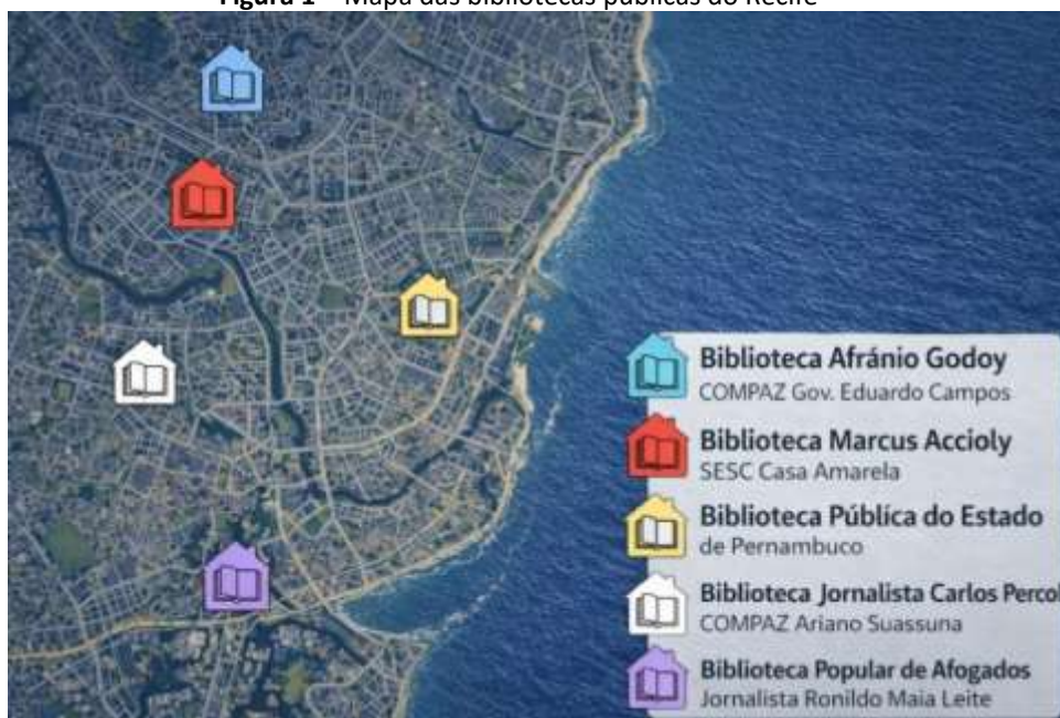
Figura 1 – Mapa das bibliotecas públicas do Recife

Para fins de ilustração, elaboramos um mapa da localização dessas bibliotecas no microcosmo recifense: