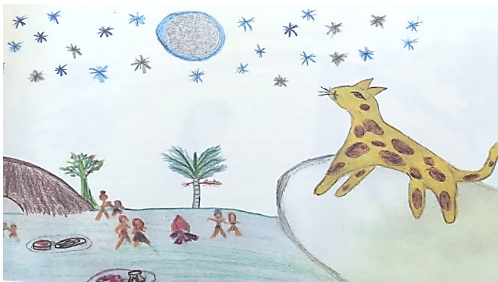
Figura 1 – Ilustração retirada do livro Fabulosas fábulas de Iauareté