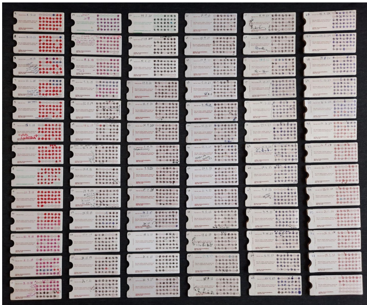
Figura 5 – Conjunto de cartelas tomadas desde outubro de 2017 até março de 2025

É, então, a partir dessa prática diária de acumular cartelas, anotando e produzindo vazios entre os medicamentos consumidos, que se concebe o trabalho da artista. O conceito de deriva aparece, nesta fase, no compromisso cotidiano de produzir anotações, guardando as cartelas, tendo possíveis vácuos entre os apontamentos, frutos do esquecimento como desvio não intencional. Ao longo dos últimos seis anos, de outubro de 2017 até março de 2025, a artista armazenou 78 cartelas de medicamento consumido. Ao observar o conjunto de todas as cartelas utilizadas (figura 5), dentre as muitas informações que se apresentam, duas questões se destacam: (1) a forma como os dias da semana estão gravados – trinta e cinco círculos, distribuídos em cinco linhas de sete colunas, preenchidos quando o medicamento fora tomado; e (2) os dias em que o remédio não foi tomado, quando os círculos permanecem sem interferência. Trata-se de formas esvaziadas pelo esquecimento, produzidas de modo aleatório.