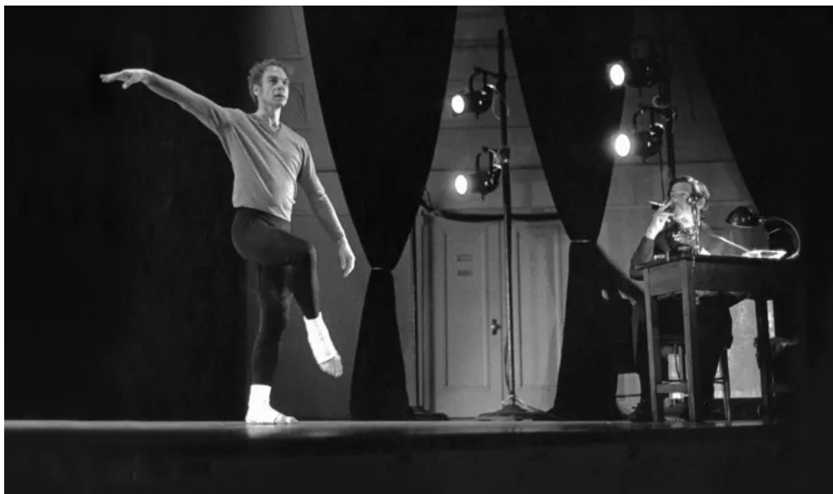
Figura 2 – Merce Cunningham e John Cage em How to Pass, Kick, Fall and Run , 1965

Desse modo, no diálogo aqui inaugurado entre Krauss, Careri e Navarro, tomamos o campo expandido como o lugar de uma deriva atualizada, como nos propõe Navarro (2011), ampliando o conceito. Partindo da noção tradicional de escultura, que se alarga com Krauss (1979), nos interessa observar como as transformações engendradas desde as décadas de 1960 irão repercutir em modos de criação entre os espaços cênico, corporal e sonoro. Pensamos como essas mudanças produzem deslocamentos nos ambientes estéticos, deixando esses significantes abertos à criação e liberando-os para frutíferos exercícios de entrelaçamento. É dessa observação que adicionamos à conversa o método colaborativo de criação entre o coreógrafo Merce Cunningham e o compositor musical John Cage (figura 2), que nos serve de exemplo de como ampliar os modos de realizar composições.