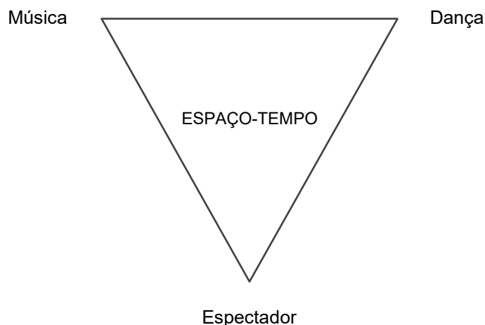
Figura 3 – Visualização da relação triangular segundo John Cage

autores). 6 Desse modo, promovem desafios para os bailarinos, que se confrontam com o ineditismo sonoro, um estímulo não ensaiado previamente, abrindo possibilidades para a surpresa, considerada essencial para Cunningham (1968). Cada apresentação é única, e cabe ao espectador a tarefa de fazer a ligação entre as expressões. Sendo assim, múltiplos triângulos relacionais se desenham abstratamente no espaço-tempo performativo, a depender do estado, da referência, do repertório e do arrebatamento de cada espectador.