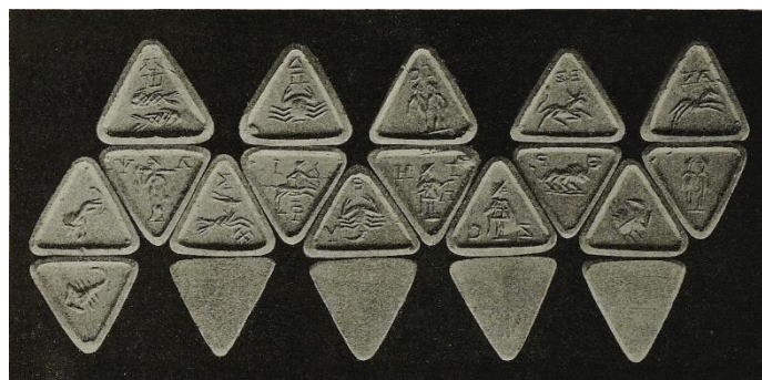
Figura 3. Detalhe da imagem de icosaedro oracular (BOLL, 1903, p.470)

Warburg (2018, p. 148) explicou que as doutrinas pitagóricas sobre números e proporções, presentes no Timeu de Platão, estimularam as pesquisas dos artistas sobre os segredos das relações harmônicas enquanto a numerologia se introduziu na esfera da magia. Na Antiguidade, o poliedro era usado como instrumento de adivinhação pela crença de que participava das forças que governavam o universo e isso também explicava o uso das tábuas matemáticas e tarô cosmológicos (Warburg, 2018, p. 147-149). Como Warburg já havia demonstrado nos estudos sobre as festas e representações do mito de Apolo 18 , o “poder dos números” foi associado até “as mais altas realizações humanas” como a música.