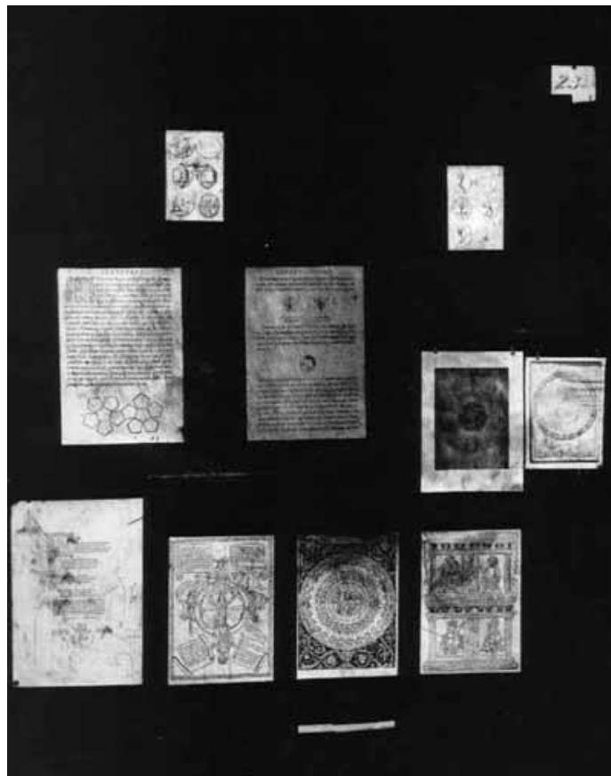
Figura 2. WARBURG, Aby. Painel 23A – Atlas Mnemosyne (1929) Fonte: La Rivista di Engramma (URBINI, 2011)